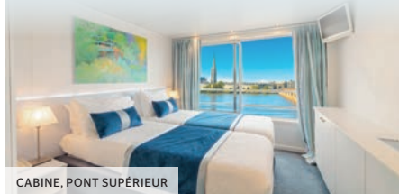
CABINE, PONT SUPÉRIEUR